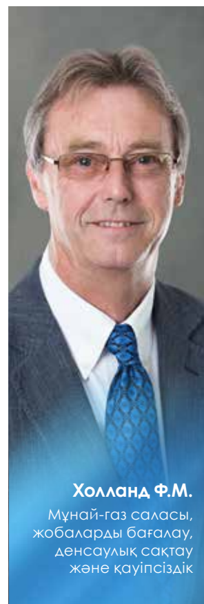
Холланд Ф.М. Мұнай-газ саласы, жобаларды бағалау, денсаулық сақтау және қауіпсіздік

ҚМГ не оның еншілес және (немесе) тәуелді ұйымдарының акцияларына иелік етпейді (тікелей немесе жанама), ҚМГ, еншілес және (немесе) тәуелді ұйымдардың акцияларымен мәмілелер жасаған жоқ.